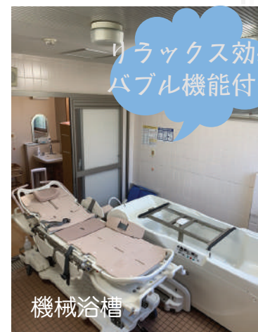
リラックス効果 バブル機能付き