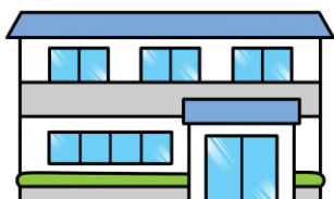
障害福祉サービス事業所等