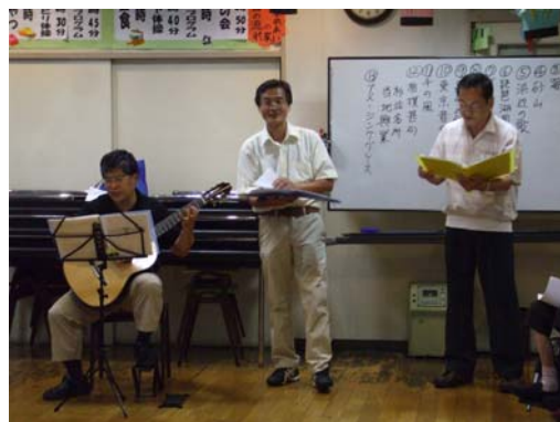
<時には賛美歌も歌います>

「ボランティアというより楽しみで来ています。」などとお話をして下さるZ'vinciの皆さんですが、私たち職員もこれからもZ'vinciの歌の会をご利用者と一緒に楽しみにしています。