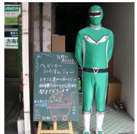
駅上で出動の時を待つ

さて、アナタ様、「階段だから、おろすんジャーだけでなく、あげるんジャーも必要なんです」とおっしゃっていましたね。この10月から、方南町駅には階段昇降援助のための“あげるんジャー職員”が配置されましたよ。アナタ様のお蔭です。「一人の行動が世の中を変える」って本当なのですね。ありがとうございました。 敬具