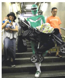
ジャーン、いざ出動です

拝啓 ベビーカーおろすんジャー様。お逢いしてからひと月になります。東京メトロ丸の内線方南町駅は、私が10年前にサンフレンズに入職してから現在に至るまで活動の拠点となっている和泉ふれあいのかの最寄駅です。しかし、この駅、足が不自由な方や重い荷物を持った方には実に使いにくい駅でして、エレベータもエスカレータもない…。元々狭い場所に建設された経緯があり、バリアフリー工事着手が難しいと言われてきました。長い間にわたる住民からの要請運動の結果、最近になってエレベータ設置場所だけは決まったものの、いまだに着工の気配がありません。