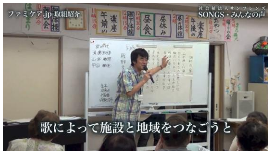
歌によって施設と地域をつなごうと