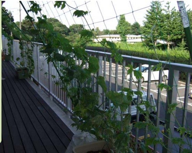
へちま・胡瓜・ゴーヤの緑のカーテン

さんも参加して、楽しく活動しています。2階ベランダには、直射日光を避け涼しく過ごせるグリーンカーテンも!こちらの成長も楽しみですね。