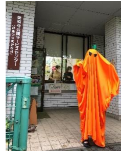
←善福寺公園に 突如現れた 人参おぼけ(笑)