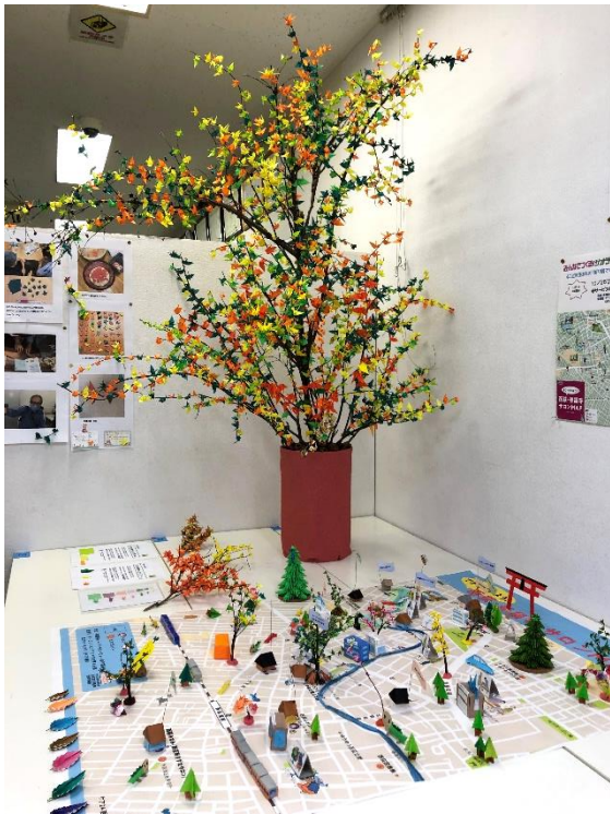
↑大きな鶴の木とジオラマ地図