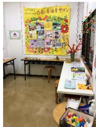
↑サロン紹介コーナー