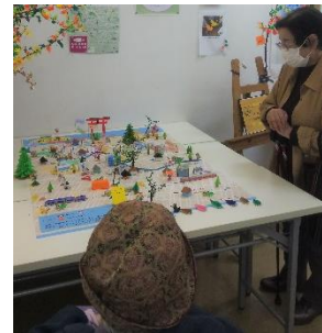
↑善福寺サロンの参加者と 見学にいきました♪ →サービスセンターでは ちょっとした折り紙教室に