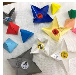
↑折り紙でおみくじを作成 60個があっという間に なくなりました!