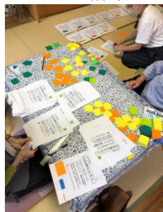
↑小さな折り紙を用意する ところからスタート